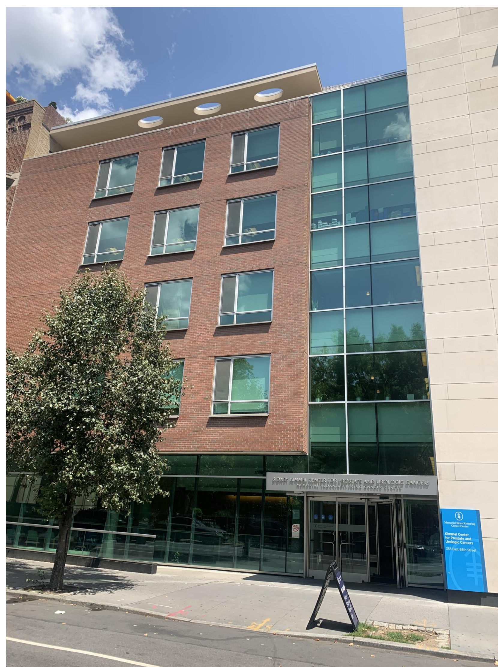
Sidney Kimmel Center for Prostate and Urologic Cancers